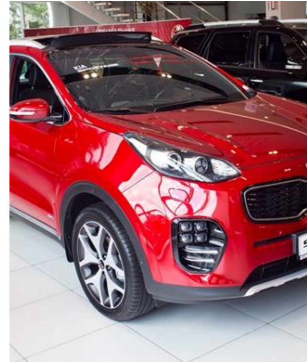
KIA Sportage, 2017 год