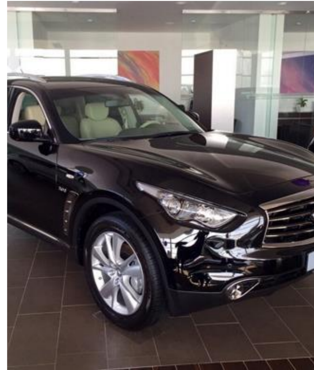
Infiniti QX70, 2017 год