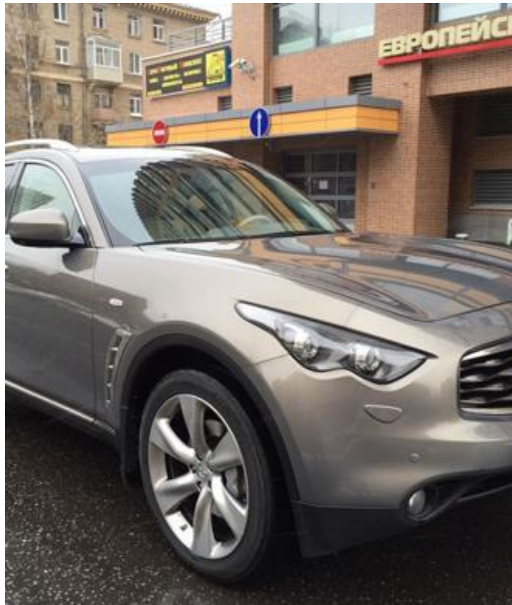
Infiniti FX50, 2010 год