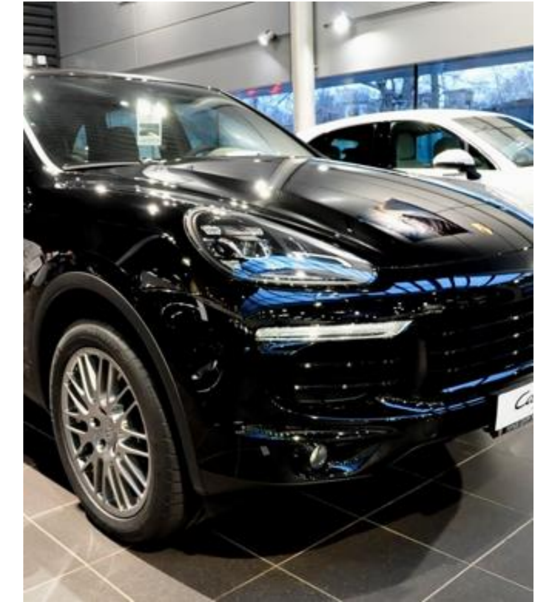
Porsche Cayene, 2017 год