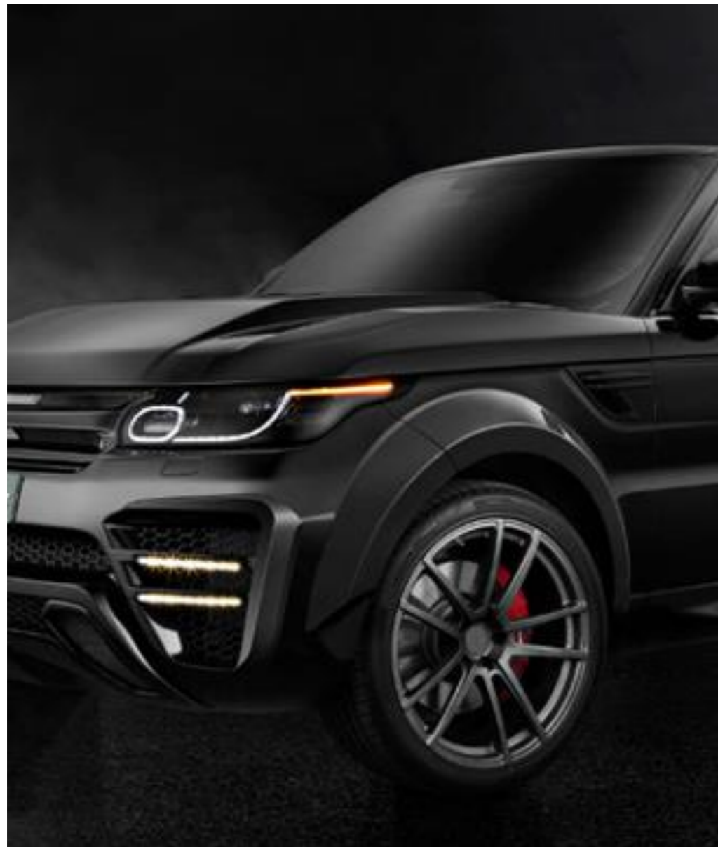
RRS, 2014 год