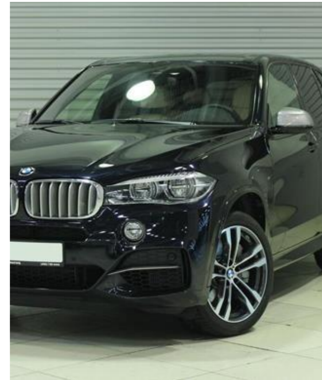
BMW X5, 2017 год