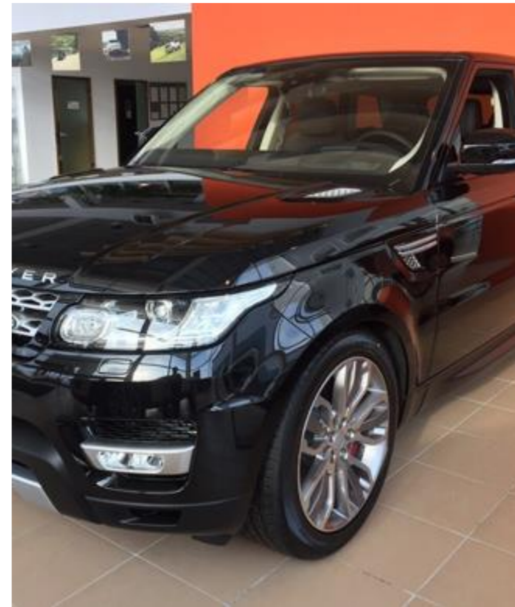
RRS, 2017 год