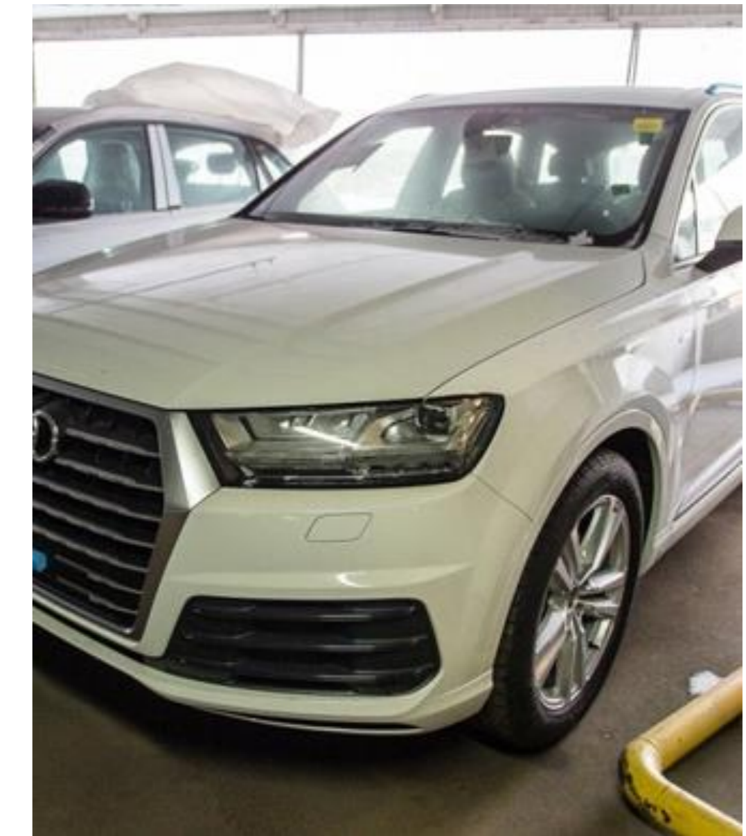
Audi Q7, 2017 год